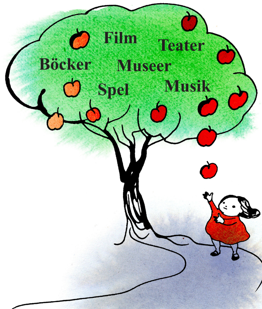
Illustration: Stina Wirsén